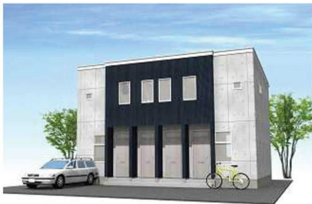
シンプルモダンダーク