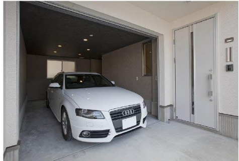
※写真は施工事例です。実際と仕様が異なる場合があります。