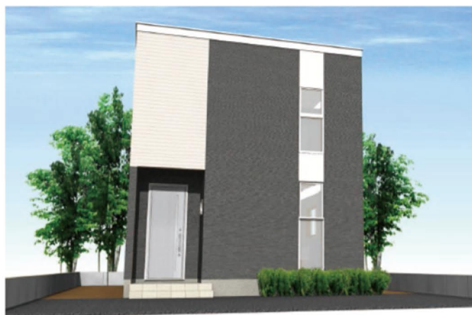
シンプルモダンダーク