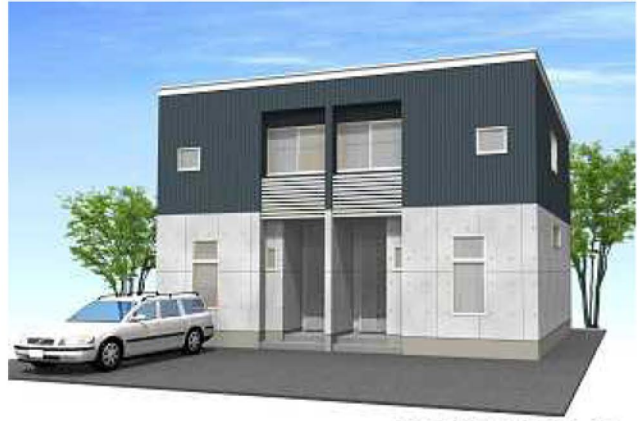
シンプルモダンダーク