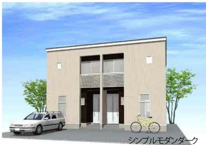
シンプルモダンターク