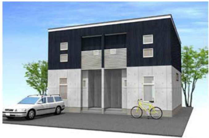
シンプルモダンダーク