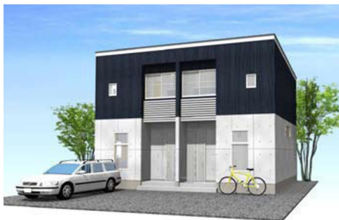
シンプルモダンダーク