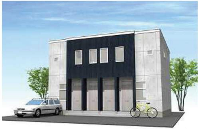
シンプルモダンダーク