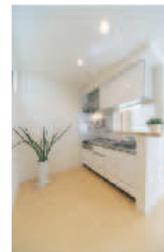
キッチン 対面 W1650タイプ