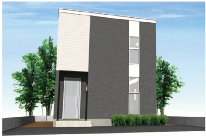
シンプルモダンダーク