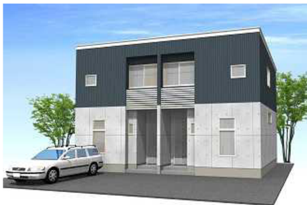
シンプルモダンダーク