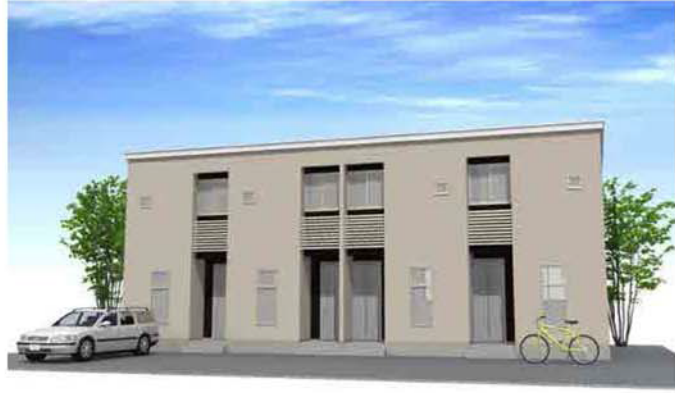
シンプルモダンダーク