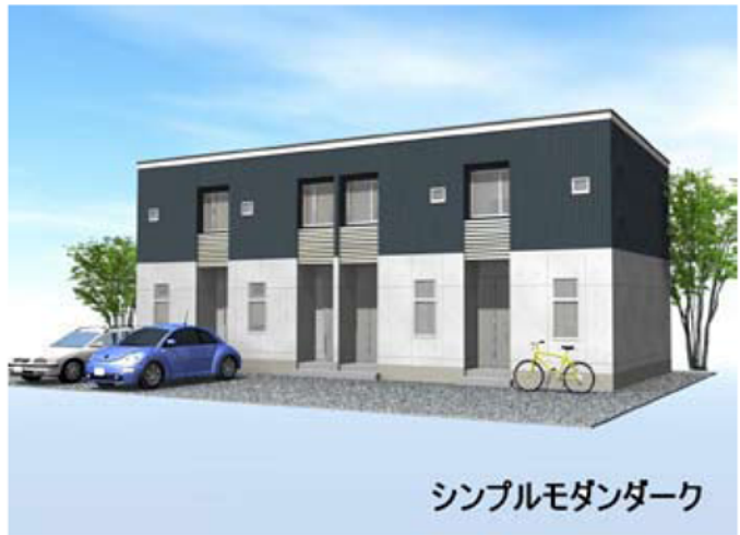
シンプルモダンダーク