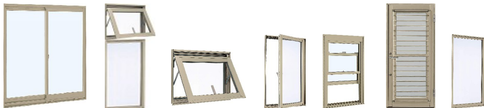
引き違い 逆り出し窓 FIX段窓 逆り出し窓 縦逆り出し窓 上げ下げ窓 採風勝手口戸 FIX窓